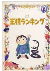
原作：十日 草輔 掲載誌：ピーコムコミックス / KADOKAWA刊 2021年放送/日本

LINEのタイムラインなどを閲覧していると、多々コミック(まんが)紹介がありますよね？そのコミック紹介によくこの「王様ランキング」が紹介されており、ネットフリックスで配信されていたので、なんとなく観てみると、すごく面白い！！舞台は中世のヨーロッパ風の世界にあるボッス王国。偉大な王が病に倒れ、二人の王子のどちらが次期王になるのかから物語が始まります。うふふ：あらすじを上手く説明できない！でもぜひ観ていただきたい作品です！