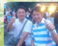
▲2019年7月 おがせ池夏祭りにて