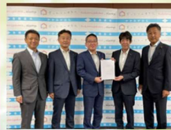
▲令和4年度予算編成に伴う颯清会要望書提出