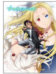
原作：田中靖規 掲載誌：集英社ジャンプコミックス刊 2022年放送/日本

ネットフリックスのおすすめ欄にも出てくる作品。サムネイル(見本画像は、かわいい女の子ですが、内容はサスペンス。舞台は、和歌山県の小さな離島・日都ヶ島(ひとがしま)。2018年7月22日、幼馴染の葬儀に参列するため2年ぶりに故郷に帰ってきた主人公は、島に起こる怪奇な現象に立ち向かっています。主人公とその仲間が様々な謎を解いていく過程に自分もその場にいるような感覚になります。そして、美しい絵とは裏腹にストーリーは、とても怖い！まだ夏前ですが、是非ご覧ください！