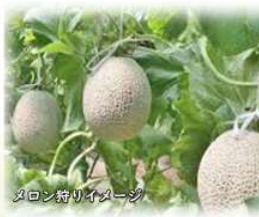
メロン狩りイメージ