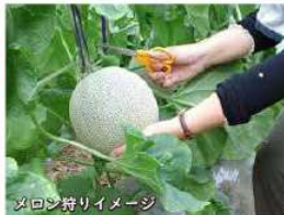
メロン狩りイメージ

費用：お一人様 12,000円 (税込) 申込締切：令和6年7月10日(水) 定員：先着40名様