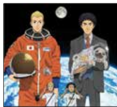
原作/脚本/キャラクター原案 小山宙哉 掲載誌/『モーニング』(講談社) アニメーション制作 A-1 Pictures 2012年~2014年読売テレビ/日本テレビ系列放送/日本

「迷ったときは、どっちが楽しいか」で決めなさい。ごく普通の家庭で育った兄弟が、子どものころ空飛ぶ円盤を見た?ことをきっかけに宇宙にあこがれ、そして、宇宙飛行士になる夢を抱き、その夢の実現に向け、兄弟で奮闘する物語!! 何度観ても感動します!! 兄弟が幼少のころに出会った天文学者「シャロンおばさん」の数々の名言が心に響きます。