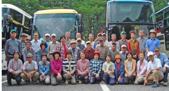
↑10周年上高地親睦旅行にて

今年より『気楽にいつでも参加を、自然の中で汗を流して地域の友人作りを』を掲げ会報を毎月発行しています。月々の活動や八木山の環境状況を会員に知らせたり、また会員間の交流作りの内容です。この会報は地域関係者にも配布され活動内容を広く知って頂く手立てにもなっています。