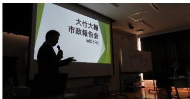
今回もパワポを活用してご説明させて頂きました。

センターにて市政報告会を開催させて頂きました。各会場100名を超えるご参加を頂き誠にありがとうございました。